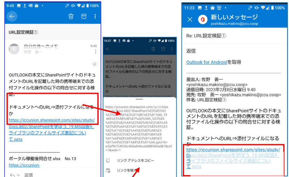
※ リンククリックでURLのドキュメントが表示される。 ※ リンクの長押しで以下の画面が表示される

モバイル版Outlookを開き、受信メールを返信する画面で添付したファイルのURLをクリックします。